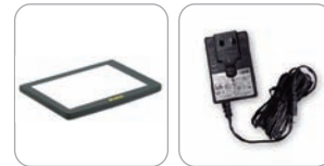
light box (rétro-éclairage)